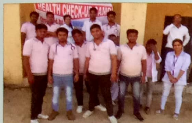
Health Check Up Camp In School