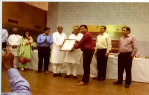
Honoring by Health Minister for Top Nursing College's in Raj.