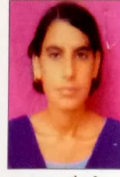
माया चौधरी राजस्थान सरकार