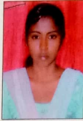
सोनिया राजस्थान सरकार