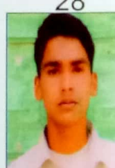
महावीर आर्य राजस्थान सरकार