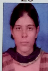
मन्जू चौधरी राजस्थान सरकार